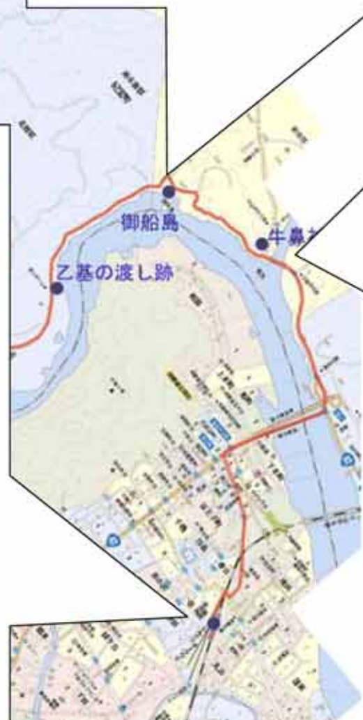
牛鼻神社 (ややバテ気味)